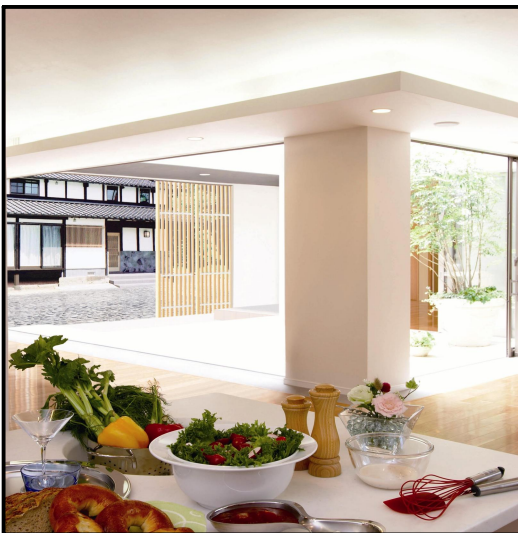
＜建物内部から中庭・可動式格子戸を望む＞