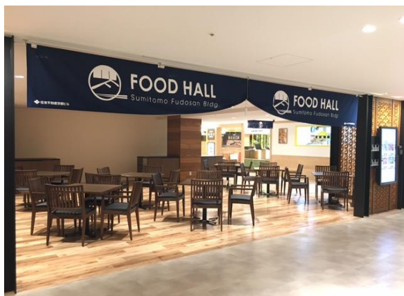
<7 階 共用スペース「イートインコーナー」>