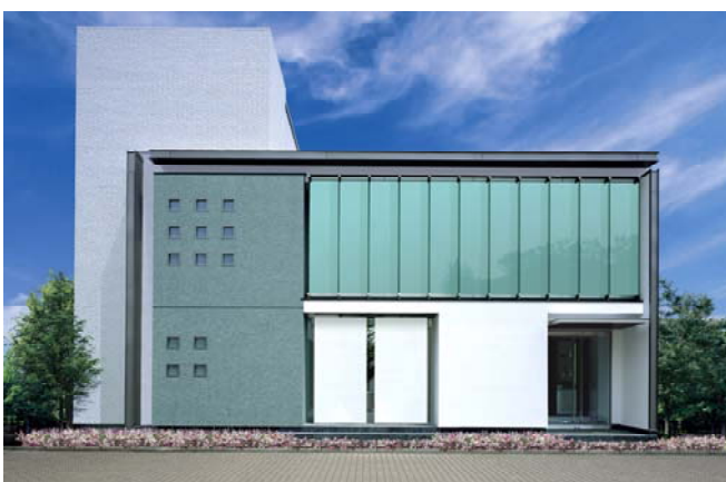
＜(仮称)森林公園モデルハウス「J・URBAN」外観イメージ＞