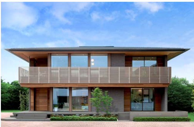
＜(仮称)札幌豊平モデルハウス「J・RESIDENCE」外観イメージ＞

弊社が注文住宅に採用しているツーバフォー工法は、道内での持家着工戸数が昨年度まで 3 年連続で 3,000 戸を超え、東京都や神奈川県と並びトップクラスの実績※がある工法です。中心となる札幌エリアは有望なマーケットと認識しており、昨年発表した新商品「 J・RESIDENCE 」と平成 15 年の発売以来多くのお客様にご好評をいただいている「 J・URBAN 」シリーズのタイプの異なる 2 つのモデルハウスを投入し、年間 60 棟の受注を目指します。※日本ツーバフォー建築協会データ