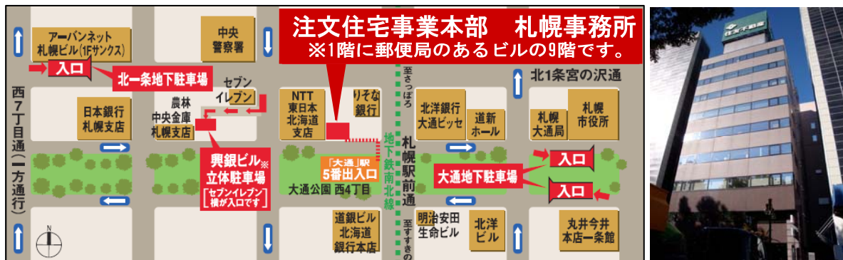
<住友成泉大通ビル外観>

【所在地】 札幌市中央区大通西 4 丁目 6-8 (住友成泉札幌大通ビル 9 階)