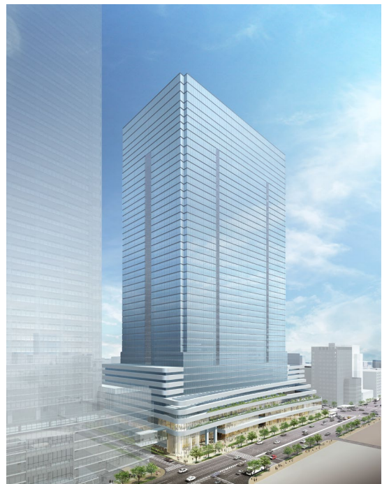
外観イメージパース(東京駅八重洲口側)

今後も、国際都市・東京の中核となる東京駅前における都市再生ならびにSDGsに貢献する100年後を見据えたサステナブルな街づくりの実現に向け、本事業を推進してまいります。