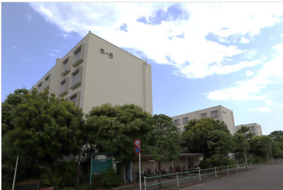
「多摩川住宅ホ号棟」外観(2021年5月撮影)

「ホ号棟」に関しては、2015年11月より事業協力者として住友不動産株式会社と株式会社長谷工コーポレーションが選定され、コンサルタントの株式会社シティコンサルタンツと共に行政協議や全権利者との合意形成活動を行ってまいりました。2020年8月に団地一括建替え決議が成立し、2021年4月に調布市の認可を受け、「多摩川住宅ホ号棟マンション建替組合」が設立されました。なお、組合設立を受け、住友不動産と長谷工コーポレーションは参加組合員としても参画いたします。