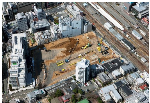
解体後(旧・公社中野住宅)