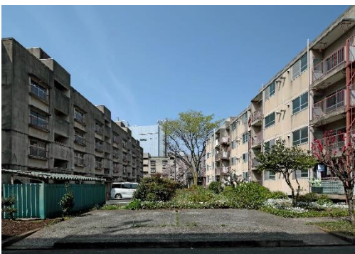
解体前(旧・公社中野住宅)