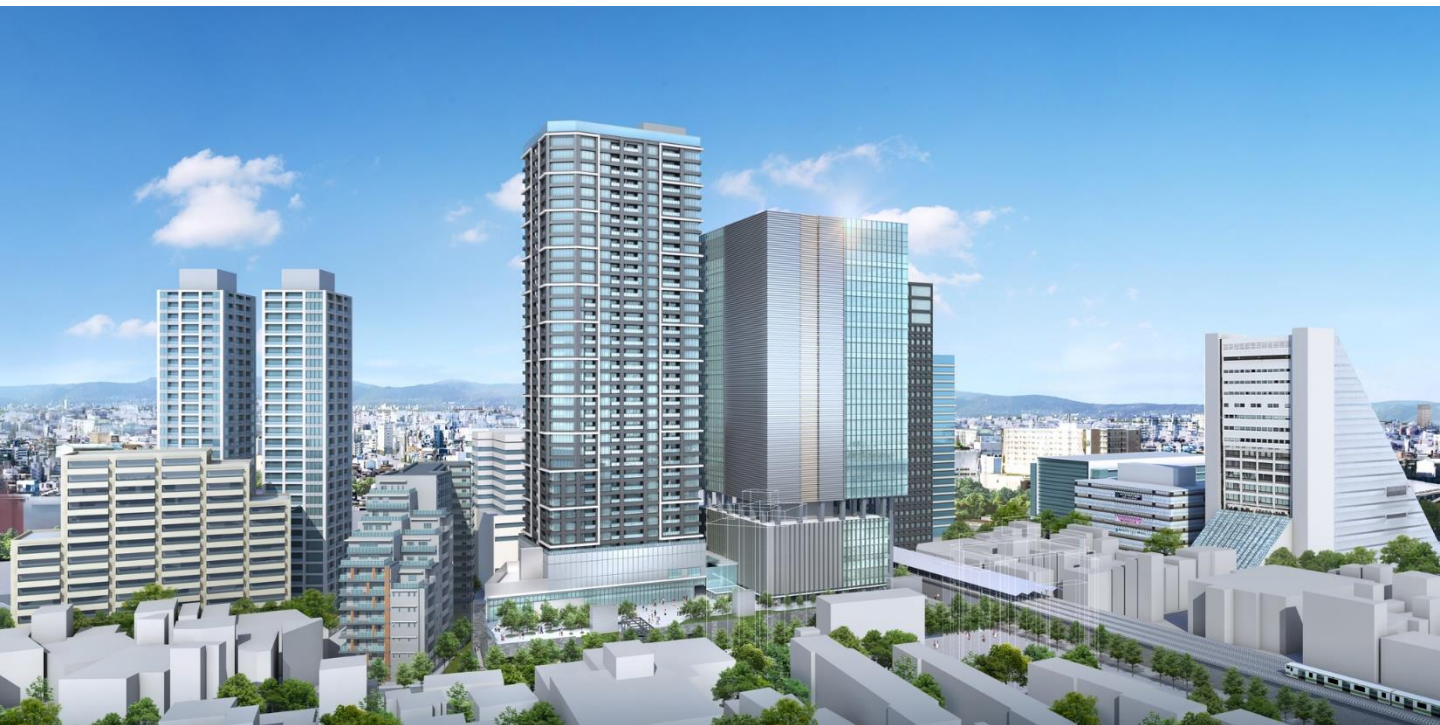
外観完成イメージパース

本事業は、市街地再開発事業と土地区画整理事業の一体的施行という手法を用いて、駅前広場の拡張整備、駅周辺の回遊性を高める交通動線の整備、また、敷地内においては、人々の憩いや交流の場となる広場空間を確保し、中野駅南口の賑わいの核となる整備を目指します。