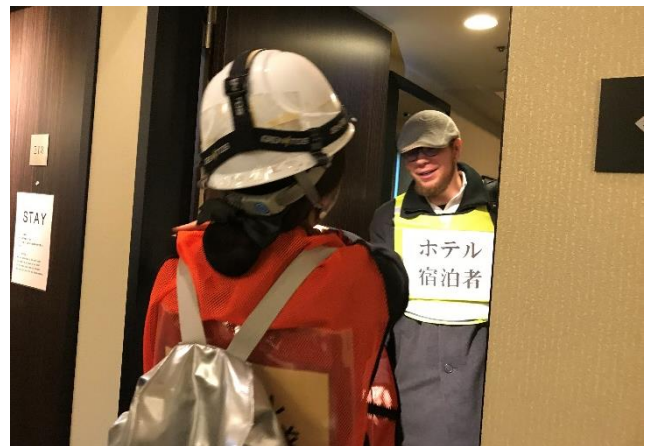
<在室する外国人宿泊客へ避難を呼び掛ける>

当日は、地域の共助の体制を構築するために、芝消防署や同エリアの「東京汐留ビルディング」「日本通運本社ビル」と3棟同時で避難訓練を実施し、約3,400名の方々に参加いただきました。