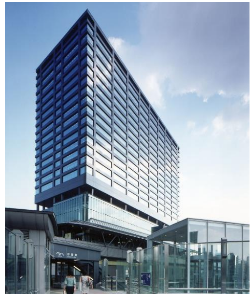
「汐留住友ビル」外観

所在地：東京都港区東新橋 1-9-3 延床面積：53,078 m 2 階数/高さ：地上 27 階、地下 4 階 竣工：2003 年 5 月