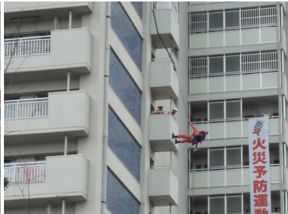
<新宿消防署による高所救助演習>