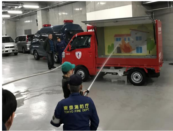
<まちかど防災訓練車での放水訓練>