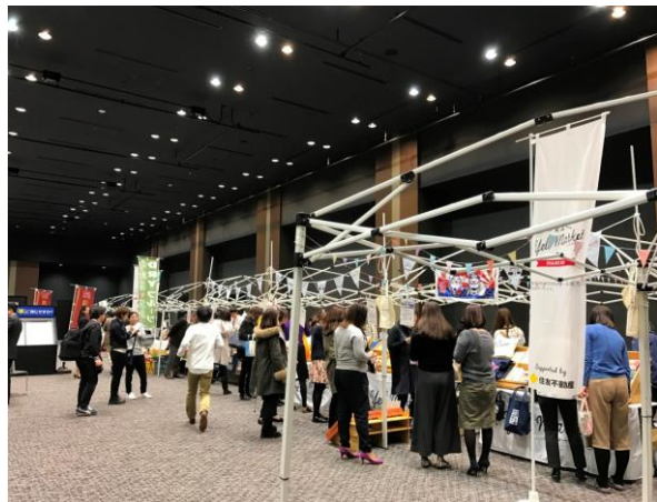
<東北エールマーケット MACHE>