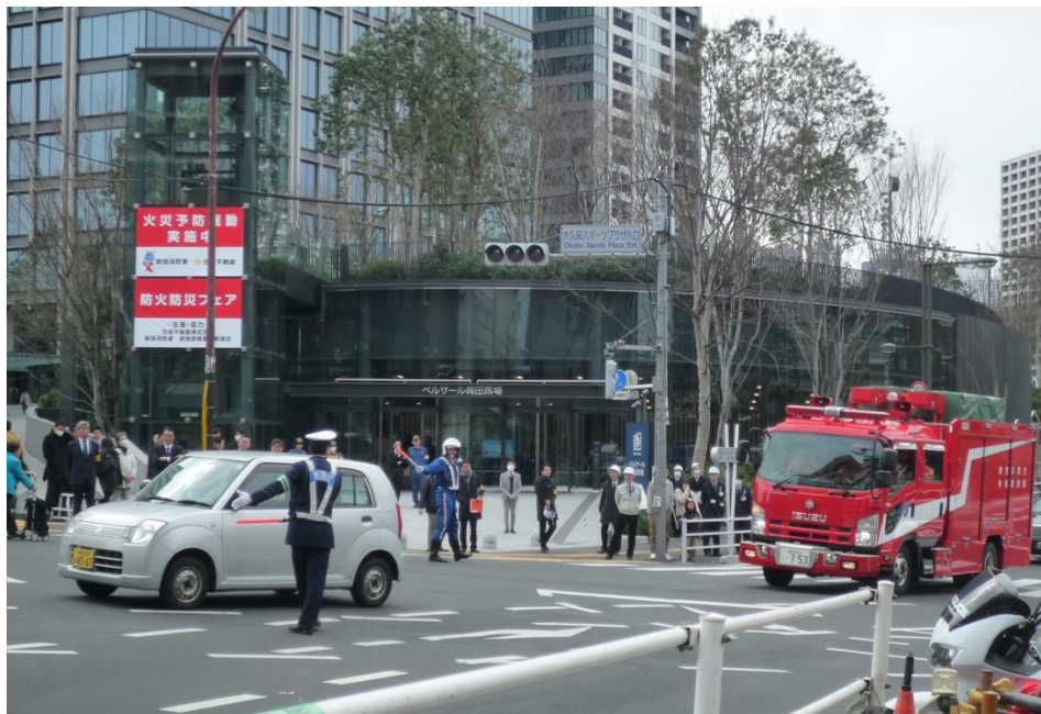
＜新宿警察署による信号を滅灯した手信号誘導訓練＞

また、同日フェア内でヤフー株式会社が WEB 上で運営している「東北エールマーケット」に当社が会場提供することで、食べ物やものづくりを通じて、東北の生産者と消費者が双方向でエールを送りあうことができる場所・機会となる「東北エールマーケット MARCHE」を初めて開催いたしました。