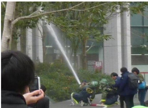
<新宿消防署による一斉放水演習>