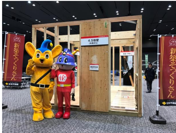
<「耐震補強」無料相談>