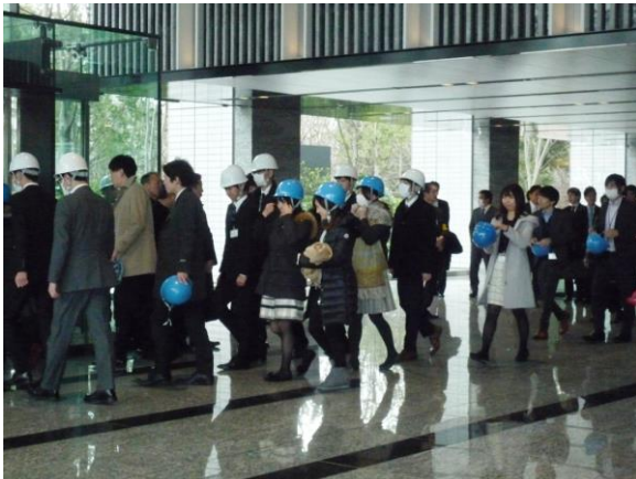
<テナント企業の避難訓練>