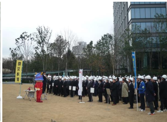
<新宿消防署 飯泉予防課長の講評>