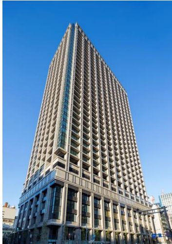
<東京日本橋タワー外観>

また、周囲には高島屋 日本橋店や大丸 東京店など多くの大規模商業施設が集積する賑わいのある場所であり、国際会議、企業商品発表、学会など特定の集客から、全国規模の大型集客イベント、販売会、展示会といった不特定多数の集客まで幅広いイベント開催に適しております。