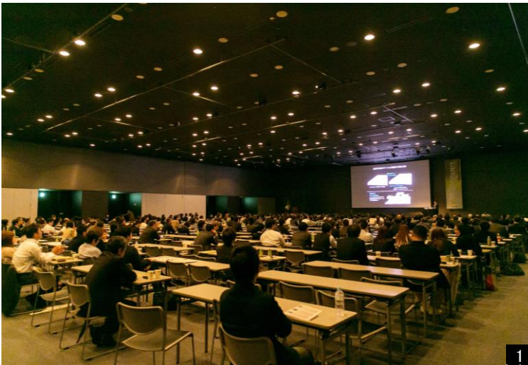
1：イベントホール 写真（ベルサール東京日本橋）

第 1 回は、日本唯一の総務専門誌「月刊総務」とコラボレーションし、顧客企業の総務担当者に向け、BCP（事業継続計画：Business Continuity Plan）をテーマに「 ベルサールカレッジ 総務キャンパス 」を開講いたします。