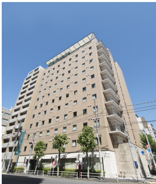
<ヴィラフォンテーヌ上野店・外観>

ハイクオリティなサービスに加え、常日頃から「危機管理体制」の高い意識を持った現場環境を整え、万全な体制のもと、安心してお客様にお越し頂けるホテルでありたいと、ヴィラフォンテーヌ各店舗共に今後の訓練を強化維持して参ります。