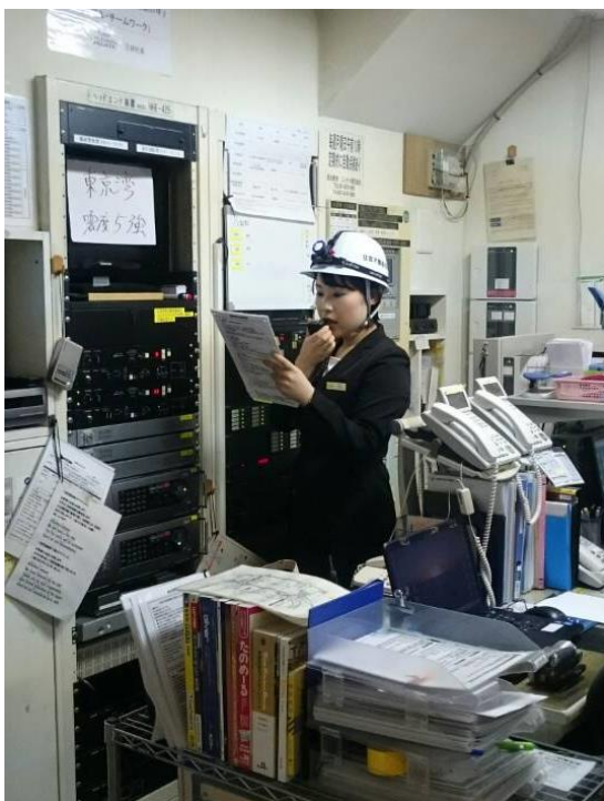
＜多言語による非常放送の様子＞

そこで先ず、「有事の際の実践的な取り組み」として日頃から特に訓練強化をしております、「防災訓練」を「インバウンド対応の防災訓練」に拡大し、3 か国語での誘導案内を訓練に導入致しました。（英・中・韓、ヴィラフォンテーヌ上野店にて実施。）