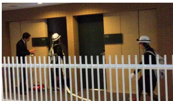
＜消火栓を用いた消火訓練の様子＞