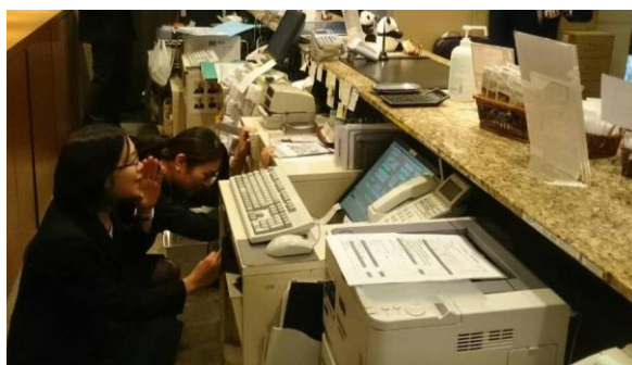
＜地震発生・身の安全を図るよう呼び掛ける様子＞