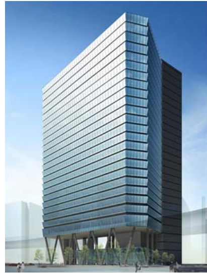
「住友不動産渋谷ガーデンタワー」外観完成予想図