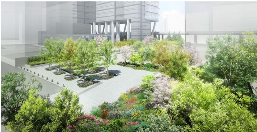
「ピロティとガーデン」完成イメージ