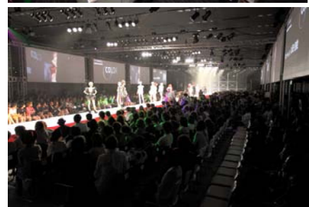
<イベント開催・例>

なお、オープンに先駆け、お客さま向けの事前内覧会を平成 24 年 5 月 16 日（水）、17 日（木）の両日完全予約制にて開催いたしますので、あわせてご案内いたします。 （開催時間 10～18 時 お問い合わせ先：03-3346-1398）