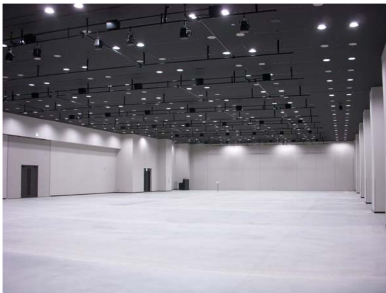
<地下 1 階ホール>

開放的な天井高 6.0m の整形無柱空間に、床荷重は大型車両の展示も可能な 800kg/ m 2 を確保しています。4t トラックで直接搬入が可能なため、イベント設営、撤収の利便性にも優れています。