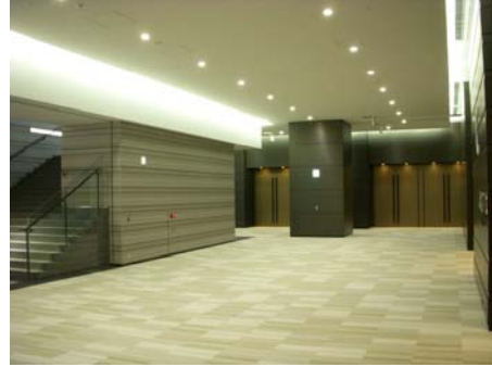
<地下 1 階ロビー>