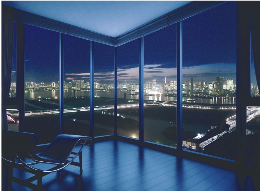
「ダイナミックパノラマウインドウ」完成予想CG