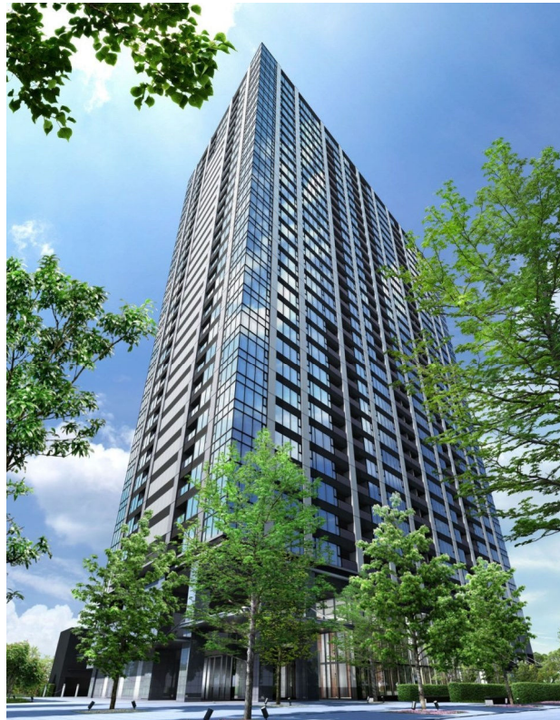
「シティタワー有明」完成予想CG

本物件は、東京都が開発を進める442haに及ぶ臨海副都心に位置し、その中でも生活利便施設の充実が急速に進む有明に建設される、超高層33階建全483戸の分譲マンションです。建物には、臨海副都心エリア初となる安心・安全の「基礎免震構造」を採用しております。さらに、機能性とデザイン性を兼ね備えた居室設計、ビューラウンジやフィットネススタジオなどの充実した共用施設で、快適さと品質を追求しております。また、本物件は、都心主要エリアへのスムーズなアクセスが可能となっており、水と緑が豊かな美しい景観を享受できる立地的特長に加え、周辺にショッピングセンターやスポーツ・レジャー施設、小・中学校など文教施設がそろった利便性の高い生活・居住環境が魅力です。