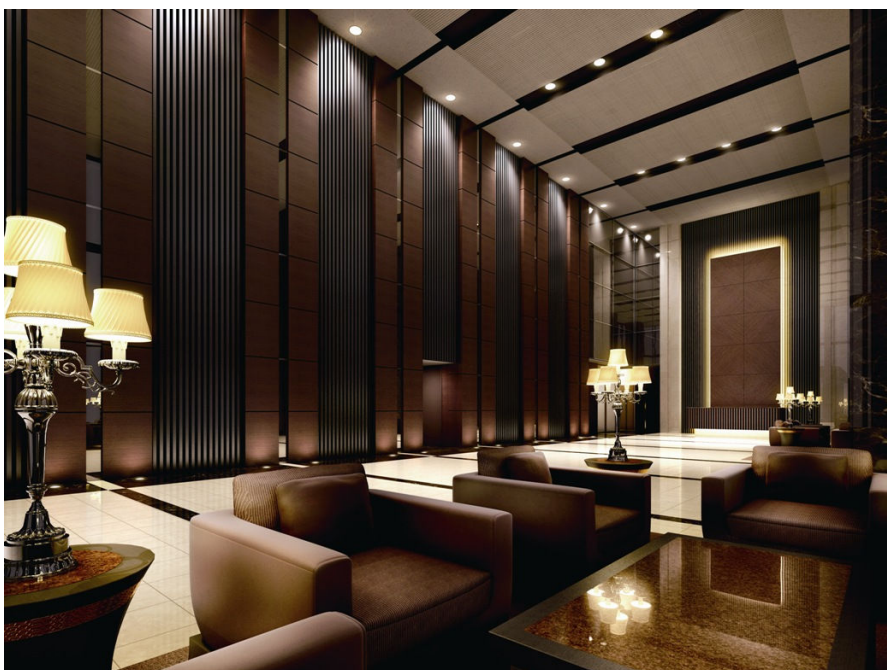
大ロビー完成予想CG

3層吹抜、約9mの天井高を誇る大ロビーには、天然石などの上質な素材を採用しました。インテリアにもこだわり、格調高い雰囲気を追求、ラグジュアリーホテルのロビーを思わせるデザインに仕上げしております。